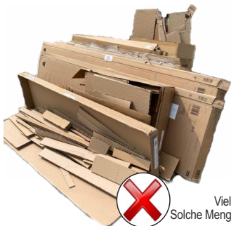
Viel zu viel für die Abfuhr! Solche Mengen werden nicht mitgenommen.

Nutzen Sie das Volumen der Altpapier- tonne aus und zerkleinern Sie Kartons und große Verpackungen. Oft sind die Tonnen mit nur einem oder zwei Kartons befüllt und weitere Kartons liegen neben den Tonnen. Diese hätten nach entsprechender Zerkleinerung noch problemlos in das Müllgefäß gepasst. Sie werden deshalb bei der Abfuhr der Altpapier- tonnen nicht mitgenommen .