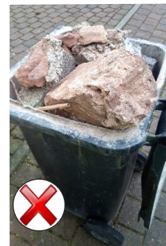
Fehlbefüllt und viel zu schwer - großes Sicherheitsrisiko -

Mülltonnen sind nicht grenzenlos belastbar. Eine 120-Liter-Tonne ist nur bis zu einem Höchstgewicht von 60 Kilogramm, eine 240-Liter-Tonne bis 110 Kilogramm von den Herstellern zugelassen. Wird der Inhalt beispielsweise stark verdichtet oder werden Bauschutt, Steine und Erde eingefüllt, wird das Gewicht oft weit überschritten. In der Bio-Tonne führen insbesondere große Mengen Fallobst zu Gewichtsproblemen.