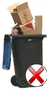
Leerung nicht möglich.

Grundsätzlich werden nur Abfallmengen mitgenommen, die in die Restmüll-, Altpapier-, Bio- oder Gelbe Tonne passen. Die Tonnen dürfen nur so befüllt sein, dass die Deckel noch schließen . Aus überquellenden Tonnen können sonst Gegenstände bei der Leerung herausfallen, Straße und Gehweg verschmutzen, parkende Fahrzeuge oder andere Gegenstände beschädigen und sogar Personen verletzen. Abfälle dürfen nicht in die Müllgefäße gepresst oder gestampft werden, da sie sonst nur teilweise oder gar nicht geleert werden können. Bei erfolgloser oder unvollständiger Leerung (z.B. wegen gefrorenen oder eingestampften Abfällen) besteht kein Anspruch auf eine erneute Leerung oder eine Gebührenminderung.