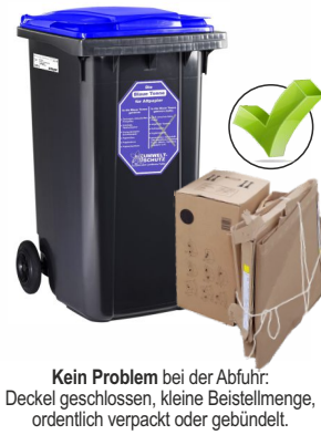
Kein Problem bei der Abfuhr: Deckel geschlossen, kleine Beistellmenge, ordentlich verpackt oder gebündelt.