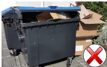
Die Tonne ist fast leer, viele Kartons stehen daneben, die nach Zerkleinerung in die Tonne gepasst hätten.

Besonders beim Altpapier werden oft große Mengen Kartons und Verpackungen zusätzlich zur Abfuhr bereitgestellt. Mitgenommen werden aber nur geringe Mengen. Dazu müssen sie ordentlich in kleinen, leichten (nicht mehr als 10 kg schweren) Päckchen oder Kartons gebündelt sein und mit ein oder zwei Handgriffen schnell aufgeladen werden können ohne auseinanderzufallen. Es ist nicht Aufgabe der Müllabfuhr, einzelne Kartons, Kartonagen oder Zeitungen einzusammeln und einzeln zu verladen. Haushalte können größere Mengen gebührenfrei an den Wertstoffhöfen abgeben. Zerkleinern Sie auch hier größere Kartonagen und Kartons, sonst sind die Container schnell voll, obwohl sie noch viel mehr Altpapier aufnehmen könnten. Andere Anlieferer können dann keine Abfälle mehr abgeben.