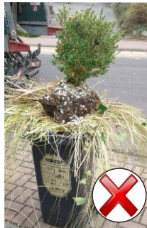
Leerung nicht möglich.

Grundsätzlich werden nur Abfallmengen mitgenommen, die in die Restmüll-, Altpapier-, Bio- oder Gelbe Tonne passen. Die Tonnen dürfen nur so befüllt sein, dass die Deckel noch schließen . Aus überquellenden Tonnen können sonst Gegenstände bei der Leerung herausfallen, Straße und Gehweg verschmutzen, parkende Fahrzeuge oder andere Gegenstände beschädigen und sogar Personen verletzen. Abfälle dürfen nicht in die Müllgefäße gepresst oder gestampft werden, da sie sonst nur teilweise oder gar nicht geleert werden können. Bei erfolgloser oder unvollständiger Leerung (z.B. wegen gefrorenen oder eingestampften Abfällen) besteht kein Anspruch auf eine erneute Leerung oder eine Gebührenminderung.